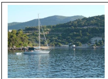
Freie Ankerplätze, ruhiger Ort