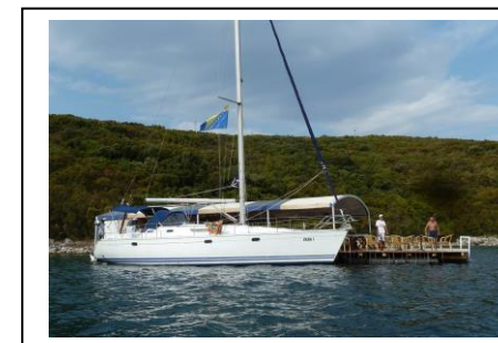
Abenteuer in Bosnien-Herzegowina

Mit der Chartersegelyacht in Dalmatien unterwegs – im Hochsommer, aber doch oft allein und an ungewöhnlichen und versteckten Orten: der neue Vortrag als Mischung aus Filmteilen, Live-Erzählungen und Kartenprojektionen ist die Fortsetzung der Vortragsserien „Einsam durch die Hochsaison“ aus 2015 und 2016. Diesmal geht es allerdings nicht mehr um unerschlossene Gebiete, sondern um Plätze, Ecken und Nischen in durchaus belebten Revieren, die aber auf irgendeine Art bis jetzt verborgen geblieben sind. Wie schon bisher gibt es weder Film noch Vortrag im Internet, sondern nur persönlich beim Clubabend, damit die Geheimtipps erhalten bleiben.