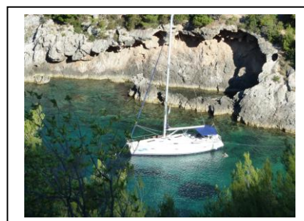
Einsame Buchten ohne Boote